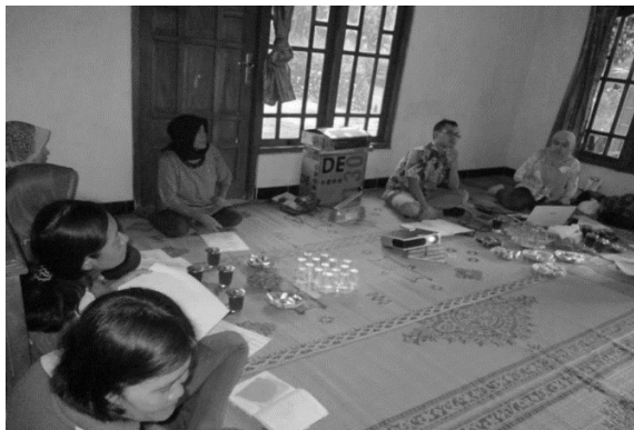
Gambar 4. Kegiatan diskusi