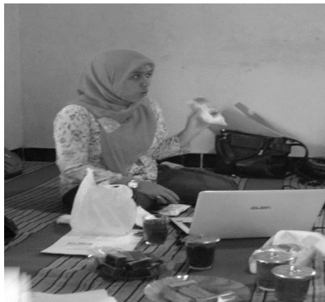
Gambar 3. Penjelasan tentang jenis-jenis pengawet alami dan buatan